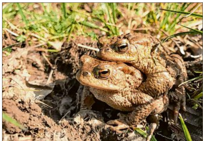
Die Amphibien sind derzeit bundesweit auf Reisen – oftmals paarweise. Dieses Foto entstand beim Angelweiher in Wiederstein.

Kröten und Frösche sind in großer Zahl unterwegs / Helfer bringen sie sicher über die Straßen