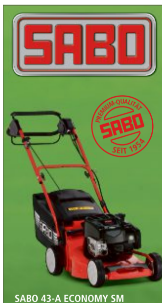
SABO 43-A ECONOMY SM

ten Bäumen. Auch Farne, Funkien oder Herbstanemonen fühlen sich ohne direktes Sonnenlicht wohl und bringen Farbe in dunkle Gartenbereiche. Zarte Blütengewächse wie Tränendes Herz und prächtige Stauden wie die Astilbe, aber auch Geißbart, Pfingstrosen und Glockenblumen verschönern den Halbschatten mit ihren Blüten. Übrigens sind die lichtärmeren Gartenbereiche auch beliebte Rückzugsbereiche für Tiere. Hier bringt man am besten Nistkästen an und kann sich auf das ein und andere Vogelkonzert freuen.