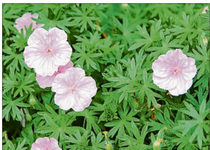
Auch schattige Lagen lassen sich mit den richtigen Stauden zu blühenden Beeten verwandeln, beispielsweise mit den zarten, rosafarbenen Blüten des Storchschnabels.