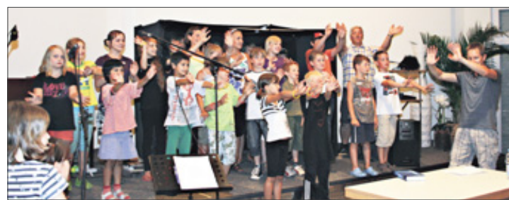
Mit einem Willkommensgruß lud der Chor zum Zuhören ein.

Anna hat es in ihrer Clique nicht leicht. Das junge Mädchen ist hochbegabt, kann sich aber von Hause aus keine coolen Markenklamotten leisten und damit ist ihre Außenseiterrolle vorgezeichnet. In der Schule und in der Freizeit wird sie von Tim, der Besserwisserin Alberta, der verfressenen Christina und vor allem von Tina gehänselt und geschnitten. Lediglich Matthias und die hübsche Katharina halten zu ihr. Das ist der Kern des Kindermusicals, das vor proppenvollem Haus in der Christlichen Gemeinde Herdorf an der Schneiderstraße die Fe-