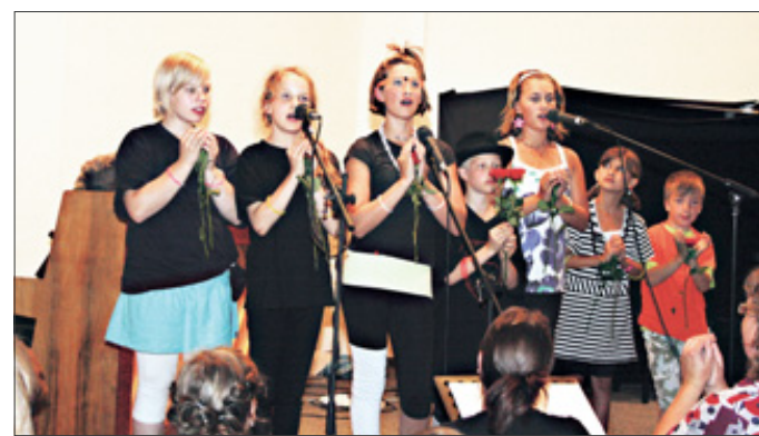
Die Akteure des Kindermusicals verdienten sich anhaltenden Beifall.

Untermalt wurde das Stück von Liederbeiträgen wie „Endlich Pause“, „Das Zeichen der Liebe“, „Zart wie eine Blume“ und Annas Solopart „Wohin soll ich gehen?“ Neben dem Beifall gab es für alle Akteure, auch für die Sängerinnen und Sänger des Eingangschors, ein Porträt-