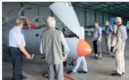
Erstaunt waren die Besucher, welche große Zahl an kleineren und mittleren Flugzeugen in den Hallen untergebracht ist.

Aspekt. Erstaunt waren die Besucher bei der Rundfahrt, welche große Zahl an kleineren und mittleren Flugzeugen in den Hallen untergebracht ist. Vom Tower aus hatte man erst den richtigen Überblick über das weitläufige Gelände. Aus erster Hand gab es Informationen, wie der Flugbetrieb abläuft. Hier muss alles vorgehalten werden, wie auf einem großen Flughafen. Im Prinzip bedeutet der Verkehrsflughafen Siegerland eine Entlastung dieser Flughäfen. Mit der Erkenntnis, dass auf der Lipper Höhe weit mehr wirtschaftliches Potential angesiedelt ist, als man angenommen hatte, machte man sich auf den Heimweg. ok