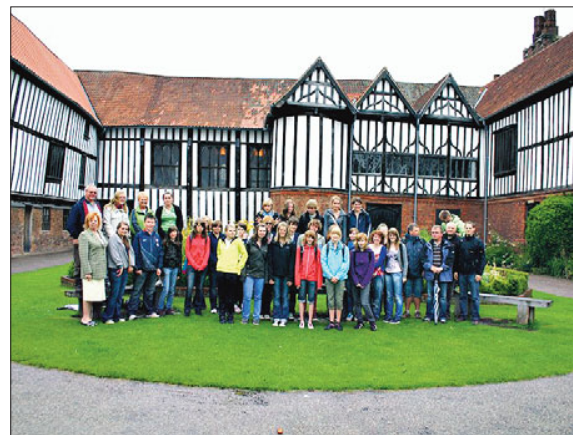
Gruppenfoto vor der „Old Hall“ in Gainsborough.

Zeppenfeld: Wohnpark am Weiher (nur für Grundschüler), Kalte Wiese (Friseur Reuter), Ort (Volksbank), Abzw. Rassberg