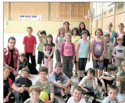
Die Kinder hatten viel Spaß bei der Tischtennisabteilung der DJK Herdorf.