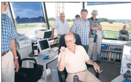
Vom Tower aus hatte man den richtigen Überblick über das weitläufige Gelände.