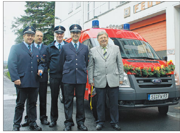
Schlüsselübergabe für den neuen MTW-Plus.

• Sa., Neunkirchen: In den Sommerferien entfällt die Vorabendmesse samstags um 18.30 Uhr in St. Theresia vom Kinde Jesu Neunkirchen. • So., Neunkirchen: 10.30 Uhr Hochamt, 16 Uhr Heilige Messe in polnischer Sprache.