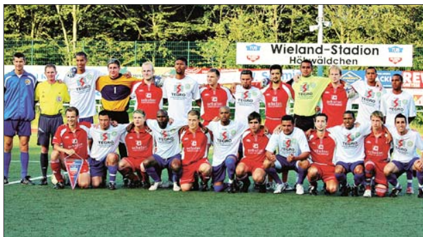
Mit einem Freundschaftsspiel des TuS Wilsdorf/Wilgersdorf gegen den 1. KFC Sao Paulo eröffnete man im Wielandstadion das brasilianische Wochenende.