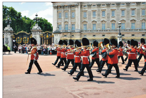
„Changing of the Guards“ – Wachwechsel am Buckingham Palace.

Mit einem herzlichen „Welcome, nice to meet you“ begrüßten die englischen Gastfamilien ihre Gäste aus Neunkirchen. 22 junge Leute aus dem Siegerland sind zur Zeit im West-Lindsey-District zu Gast. Auf dem Programm stehen Ausflüge nach York, nach Whitby an die Küste, eine Höhlentour im Peak-District-National-Park und natürlich Fahrten nach Lincoln und London. Gemeinsam mit den jugendlichen Gastgebern erleben die Siegerländer die erste Woche der englischen Ferien.